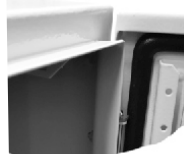
Detail hrany skeletu