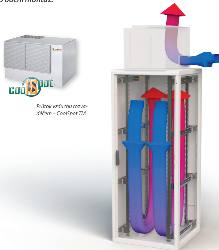
Průtok vzduchu rozvaděčem – CoolSpot TM

Standardní záruční doba je 12 měsíců. Více informací, viz strana 5.