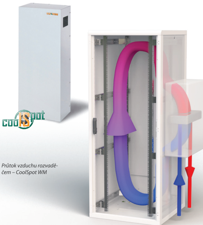
Průtok vzduchu rozvaděčem – CoolSpot WM

Standardní záruční doba je 12 měsíců. Více informací, viz strana 5.