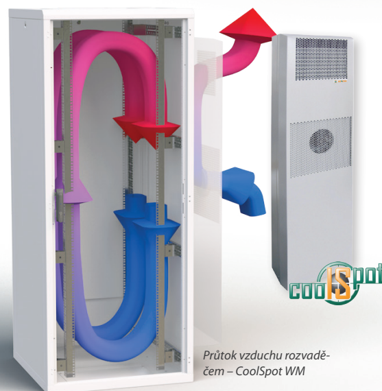
Průtok vzduchu rozvaděčem – CoolSpot WM

Řešení CoolSpot DX může být připojeno k systému monitorování rozvaděče Conteg z důvodu upozornění uživatele na příliš vysoké teploty.