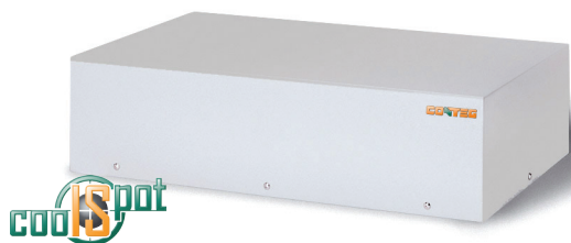
Průtok vzduchu rozvaděčem – CoolSpot TM